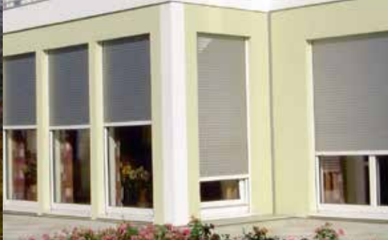
Comutare dirijată de timp – „Bună Dimineața” tocmai la timp