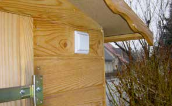
Montare simplă oriunde – comutare fără curent