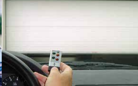
Deschiderea garajului realizată avantajos – pentru toate antrenările