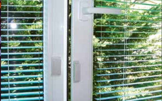
Siguranță cu comutatori radio cu magnet