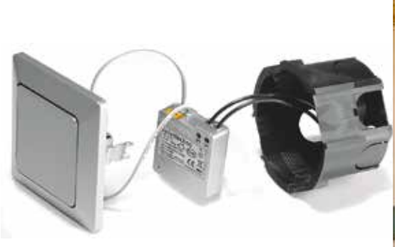
Instalare simplă în spatele comutatorului