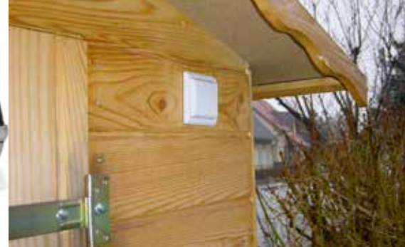
Einfalt að koma fyrir alls staðar - straumlaus rofi.