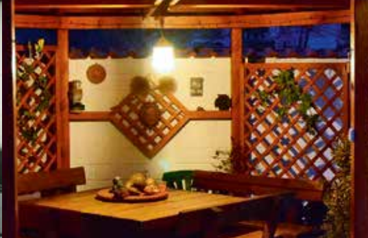
Lýsing á heimili og í garði