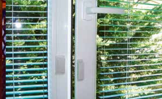
Öryggi með Funk-segulumögnuðum rofa