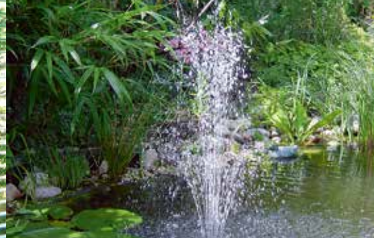
Stjórn á gosbrunni