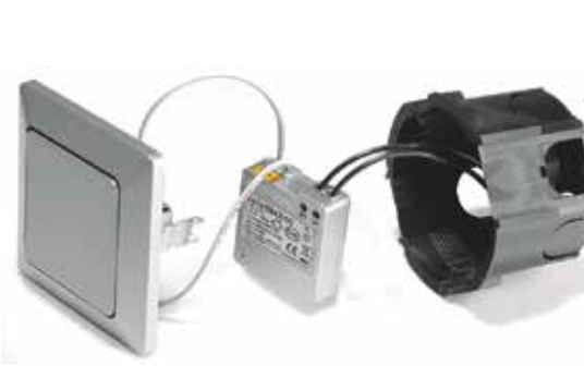
Egyszerű felszerelés a kapcsoló mögött