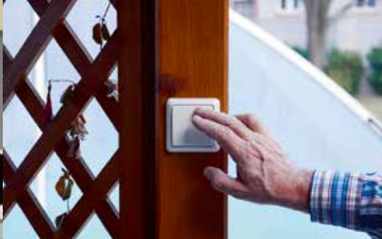
Vezeték nélküli kapcsolás a kertben