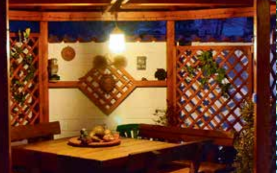
Világítás a házban és a kertben